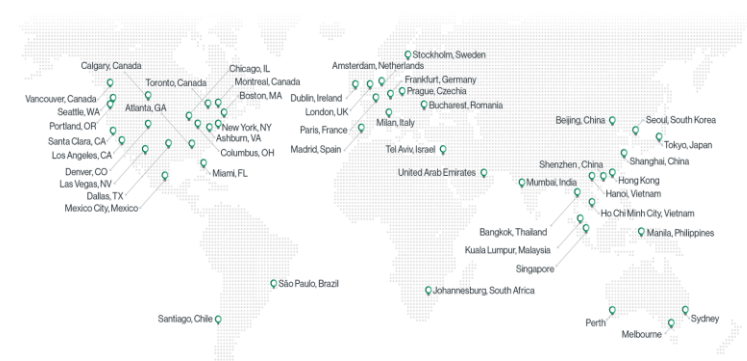
世界50か所以上のPoPが、最適化されたネットワークアクセスを提供